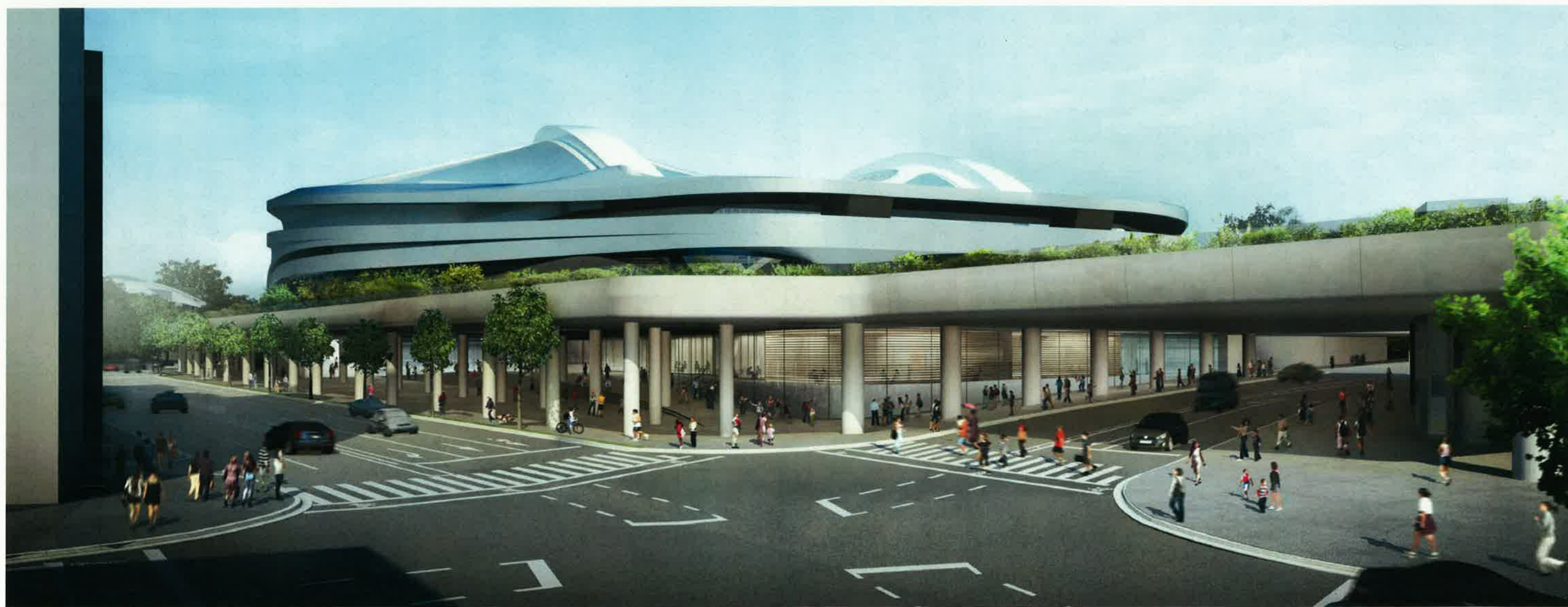
日建設計・梓設計・日本設計・アラップ設計共同体 作成