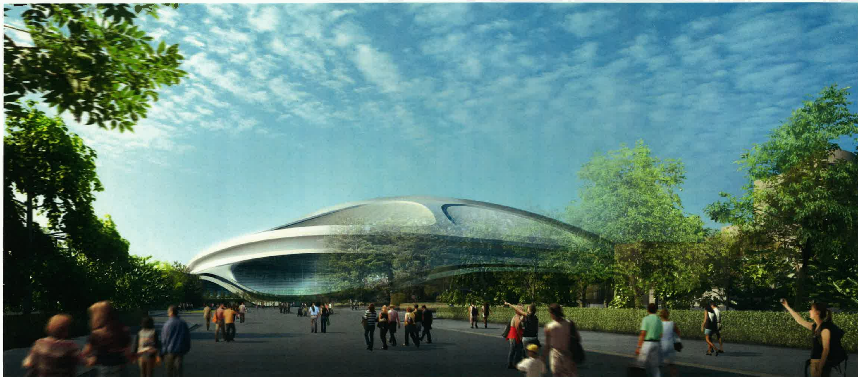
日建設計・梓設計・日本設計・アラップ設計共同体 作成