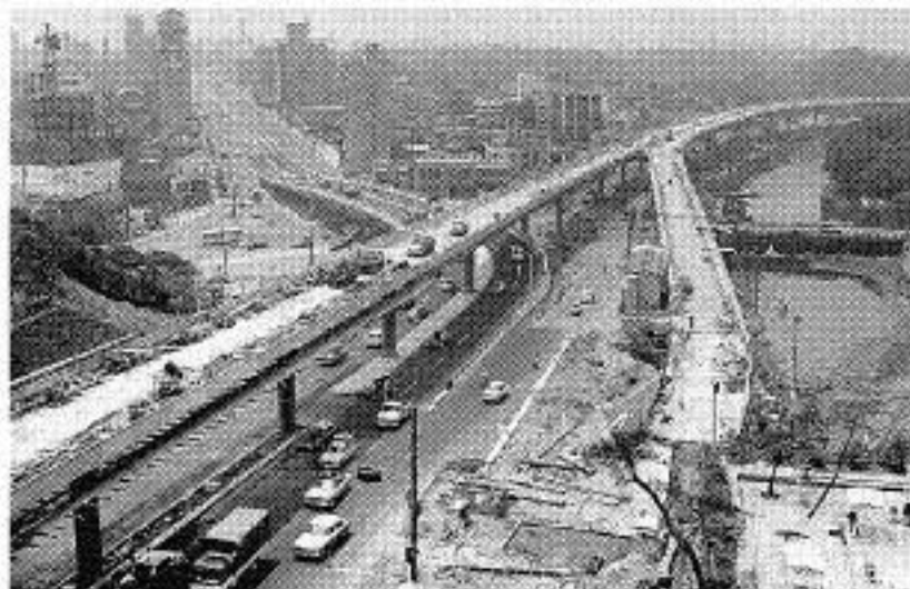
建設中の首都高速道路 (赤坂見附付近、1964年6月)

大会前後に特別態勢を組んで行い、期間中はできるだけしないようにし、ゴミ収集も朝8時から早朝作業を実施することにした。「汲み取りやゴミ収集をオリンピック観光にやってくる内